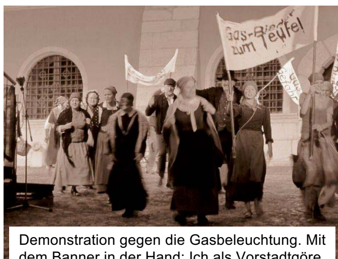
Demonstration gegen die Gasbeleuchtung. Mit dem Banner in der Hand: Ich als Vorstadtgöre

Beim „Gerücht“, weil es mein erstes und somit auch das aufregendste Freilicht war, beim „Giftmischer“, weil ich dort eine gute Freundin kennen gelernt habe und beim „Gas-Streit“, dem dritten Stück, weil ich eine kleine Sprechrolle hatte.