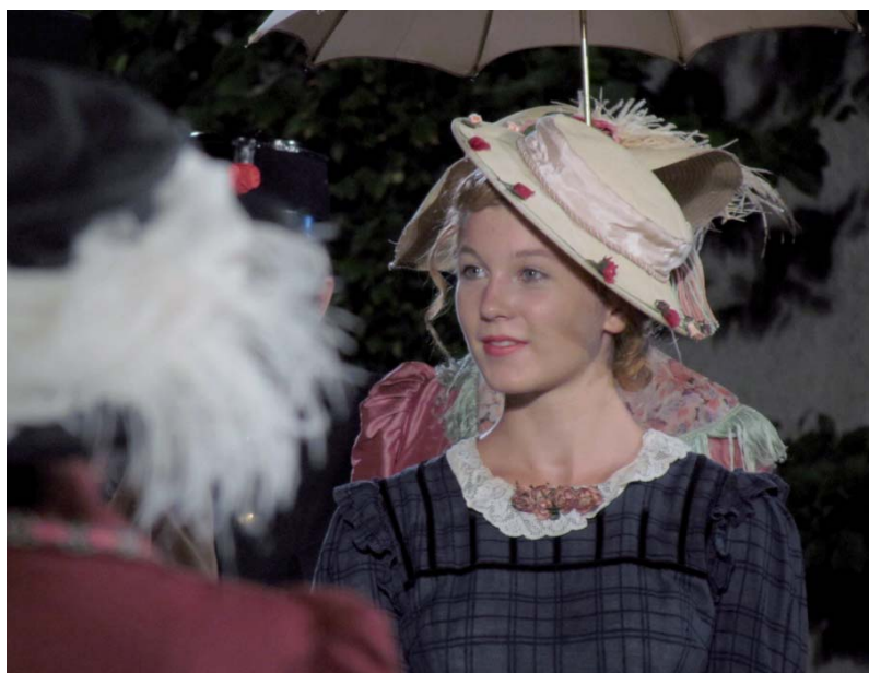
Als Bürgerstochter auf einem Fest des Gasfabrikanten

Obwohl es mir fast immer Spass gemacht hat, in eine andere Rolle zu schlüpfen, werde ich, falls es in zwei Jahren wieder stattfindet, wahrscheinlich nicht mehr mitmachen.