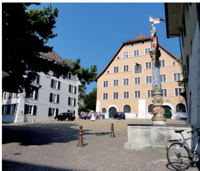
Der Zeughausplatz in Solothurn

Auf diesem historischen Platz beim heutigen Zeughaus (in dem früher Waffen aufbewahrt wurden - heute ein Museum) – wurden vor ursprünglicher Kulisse unter freiem Himmel Theaterstücke aufgeführt mit historischem Inhalt rund um die Geschichte Solothurns.